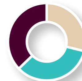
Tipo de Recursos