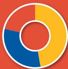
Tipo de Recursos