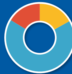
Tipo de Recursos